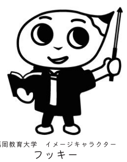
福岡教育大学 イメージキャラクター フッキー

うきうき Teacher! 詳細・事前申込ページ ※事前申込は9月2日(月) 9:00 開始